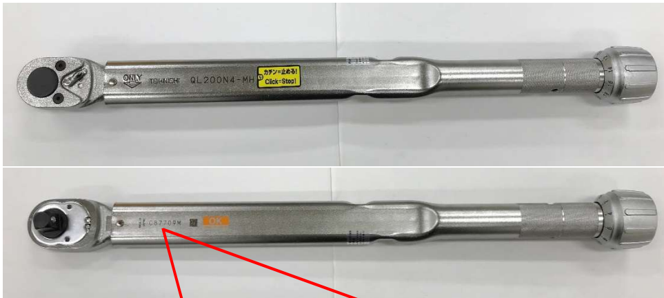
製造番号表示位置