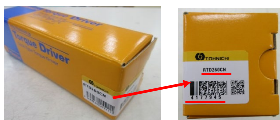
梱包箱、ラベルの型式・製造番号確認位置