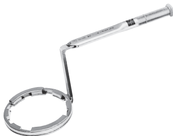
大梅花头扭力扳手